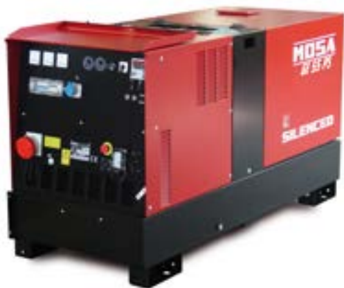
GE 55 PS →

PERKINS / trifásico / super insonorizado