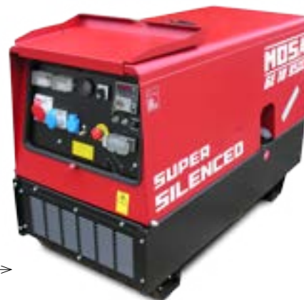
GE 10 YSXC →