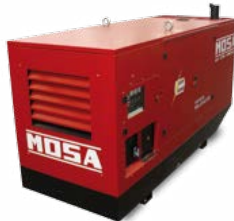
GE 275 FSX →