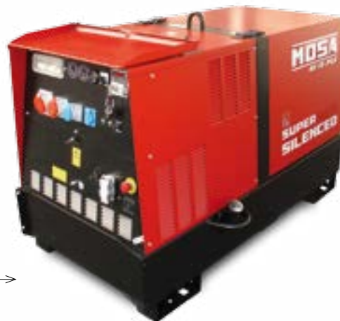
GE 15 PSX →

PERKINS / trifásico / super insonorizado