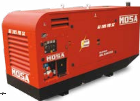
GE 385 FSX →