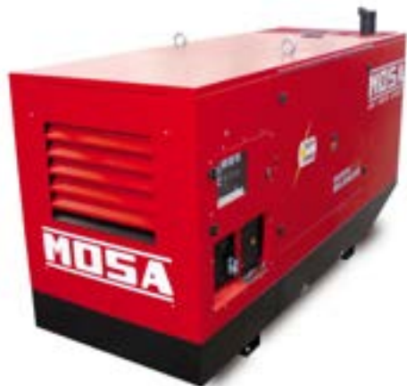
GE 165 FSX →

FTP (IVECO) / trifásico / super insonorizado