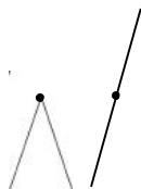
2 posições uso